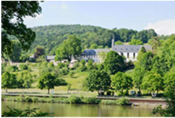
Stift Neuburg Heidelberg