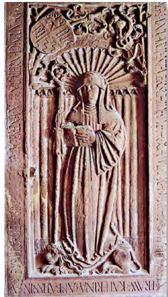
Äbtissin Katharina von der Pfalz