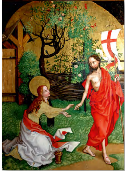
Maria Magdalena von Martin Schongauer (* um 1445/1450 in Colmar; † 2. Februar 1491 in Breisach)

Da der Sabbat unmittelbar bevorstand, musste man sich beeilen, den Leichnam Jesu vom Kreuz abzunehmen und in ein Grab zu betten. Da blieb keine Zeit mehr für die üblichen Bestattungsvorbereitungen, etwa dass man den Toten, wie es Brauch war, mit wohlriechenden Salben und Kräutern einrieb. Doch Maria Magdalena hatte diesen Liebesdienst nicht vergessen. Sie wartete bis der Sabbat zuende war und eilte dann, sobald es das Gesetz erlaubte, zum Grab. Ihre Trauer ließ sie aber nicht in Resignation und Niederge-