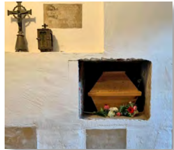
Der Sarg von Br. Pius wurde die Grablege geschoben.

Seit 1927 wieder Mönche in Neuburg einzogen, wurden die Toten auf einem kleinen Friedhof hinter der Kirche im Ostpark bestattet. Der kleine Friedhof wurde inzwischen aufgegeben. Die Toten sind aber nicht vergessen. Ihre Namen befinden sich auf einer Tafel in der Gruft.