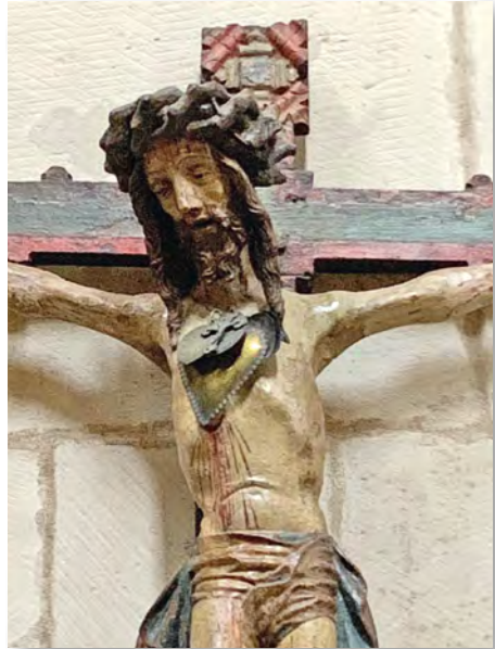
Pestkreuz im Paulus-Dom zu Münster

Schwer genug! Denn da ist ja nicht nur das Kreuz Jesu. Da ist auch unser Kreuz und das Kreuz der Anderen. Die ganze Welt scheint die Signatur des Kreuzes zu tragen. Fühlen wir uns oft nicht hilflos und völlig ohnmächtig angesichts des Leidens so vieler Unschuldiger? Die Welt selber scheint zum Problem geworden zu sein, und nur der Glaube an die Liebe Gottes, der sich in Jesus Christus mit uns vereint, bringt Licht in ihre Finsternis und erhellt die Not unserer Tage.