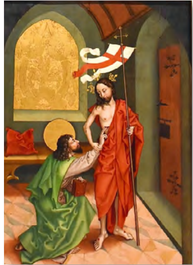
Apostel Thomas von Schongauer

Es ist auch unser Weg, unser je eigener Weg, den wir auf dem Grund unseres Herzens auch immer schon wissen. Einfach und leicht ist der Weg, den der Auferstandene weist, aber wohl eher nicht. Doch ihn zu gehen ist unsere eigentliche Lebensaufgabe: Ganz zu uns selbst zu kommen, heil zu werden und Zeugen der Auferstehung und des Lebens zu werden, immer mehr.