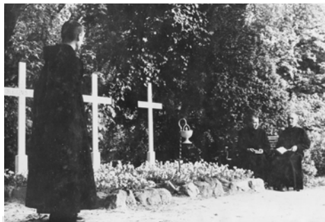
Ehemaliger Friedhof hinter der Kirche

In Johannesevangelium 11, 25-26 sagt Jesus zu Martha, der Schwester des verstorbenen Lazarus: „Ich bin die Auferstehung und das Leben. Wer an mich glaubt, der wird leben, auch wenn er stirbt; und wer da lebt und an mich glaubt, wird nicht sterben in Ewigkeit.“