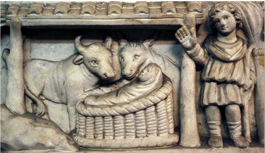
Frühchristliche Weihnachtsdarstellung, nur mit Ochs und Esel und einem Hirten

Franziskus sagte: „Ich möchte in voller Wirklichkeit die Erinnerung an das Kind wachrufen, wie es in Bethlehem geboren wurde... Ich möchte es mit meinen leiblichen Augen sehen, wie es war, in einer Krippe zu liegen und auf Heu zu schlafen, zwischen einem Ochsen und einem Esel.“ Von Anfang an gehören also Ochs und Esel zur Krippe dazu. Man bezog sich auf ein Zitat aus dem Buch Jesaja: „Seinen Eigentümer erkennt ein Ochse, ein Esel die Krippe seines Herrn; Israel aber hat keine Erkenntnis, mein Volk hat keinen Verstand.“