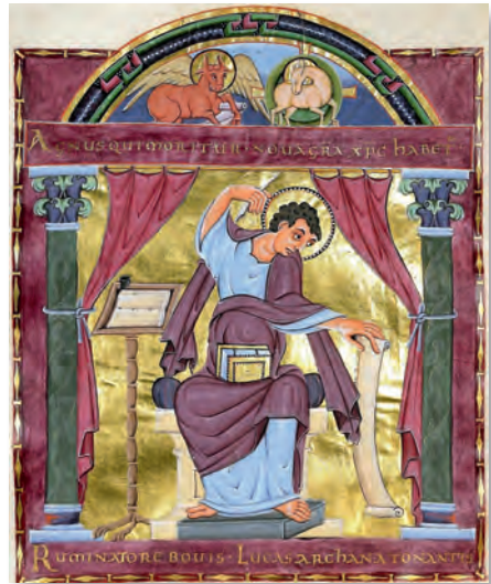
Lukas, Evangeliar Heinrichs II., Reichenau

Dort wurde die existentielle Frage gestellt: „Meister, was muss ich tun, um das ewige Leben zu gewinnen?“