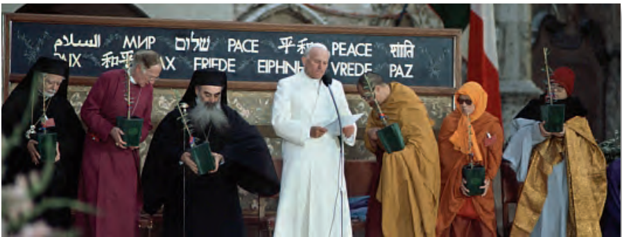
Johannes Paul II. beim von ihm ins Leben gerufenen Friedensgebet in Assisi mit Vertretern aller Weltreligionen

Auch beim persönlichen Gebet bringt der Beter immer die mit vor Gottes Antlitz, die zu ihm gehören, für die er betet, ausdrücklich oder nicht. Alle, die zu ihm gehören, stehen vor Gott. Das Vaterunser ist das große Bittgebet. Beginnen wir mit dem zweiten Teil: „Gib uns täglich das Brot, das wir brauchen“. Jesus steht mit seinem Gebet unter den Armen.