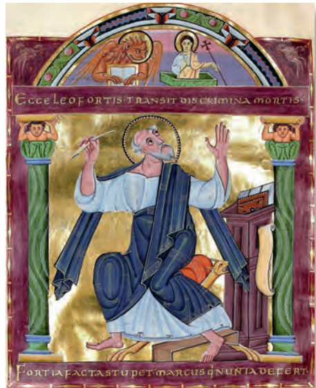
Matthäus-Evangeliar Heinrich II., Reichenau

Das Vaterunser beginnt mit der vertraulichen Anrede „Vater“. Jesus redete Gott mit Abba an, das „lieber Vater“ bedeutet. Die Anrede Gottes mit „Vater“ war sowohl für Griechen als auch für Juden üblich. In einer direkten Übersetzung aus dem Aramäischen heißt es an dieser Stelle „Vater und Mutter alles Geschaffenen“.