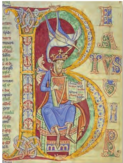
David mit der Harfe, Buchmalerei aus dem berühmten Albani-Psalter

Wer wie Jesus immer wieder in die Nähe und Gegenwart Gottes eintaucht, wird der permanenten Versuchung widerstehen können, der Hoffnungslosigkeit dieser Welt, ihrer Resignation und ihrem Zynismus zu erliegen. Auch wenn Gerechtigkeit, Frieden und Versöhnung scheinbar niemals zu erreichen sind, so wird der wie Jesus betende Mensch an der Welt nicht verzweifeln, weil er wie Jesus aus der Gegenwart Gottes lebt. Nicht Not lehrt beten, wie ein altes Sprichwort sagt, sondern der Blick auf den Menschen, in dem wie in keinem anderen Gott wohnte – Jesus von Nazareth.