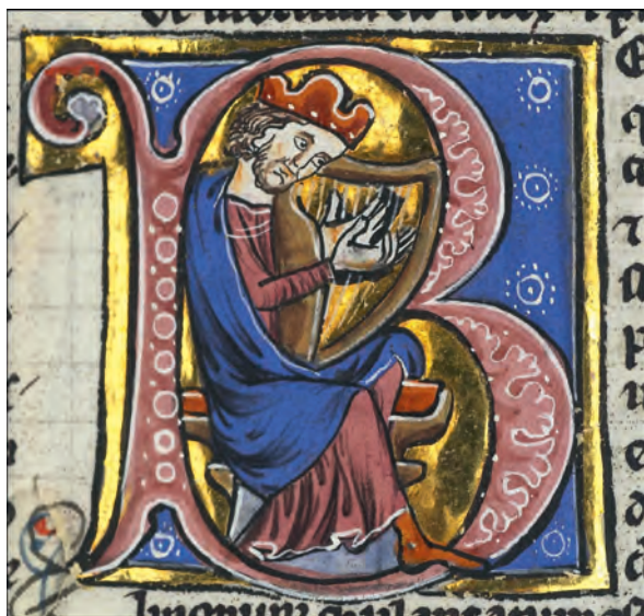
David mit der Harfe, Buchmalerei aus dem Kloster Lorsch, von dem Stift Neuburg 1130 gegründet wurde.

können: immer wieder aus dem Getriebe des Alltags aussteigen, um die Nähe des geliebten Vaters zu suchen. Ein großer Wille und eine große Entschiedenheit war zu allen Zeiten gefordert.