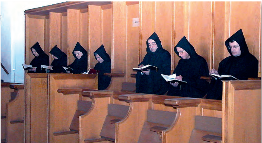
Mitbrüder beim Chorgebet im ehemaligen Chorgestühl.

Dieses „zum Leuchten bringen“ verbindet das Reich Gottes mit dieser Welt. Wenn zwei oder drei miteinander Gottes Liebe verwirklichen, dann geht von ihnen etwas aus, das die ganze Welt verändern kann.