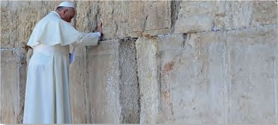
Papst Franziskus an der Klagemauer in Jerusalem

Er weiß sich zuerst zu den Armen gesandt. Auch das betont Lukas immer wieder. Es geht zunächst um das elementare Überleben. „Gib allen Menschen, was sie für den nächsten Tag brauchen“; für noch immer viel zu viele Menschen einfach das Stück Brot, das sie nicht verhungern, aber auch Anerkennung, Liebe, Verstanden-Sein, Arbeit, die erfüllt, Wertschätzung, Heimat.